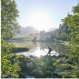
Lecknertal mit Lecknersee

Gerne stehen wir für weitere Ausflugstipps zur Verfügung